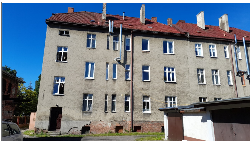
Fot. Elewacja tylna